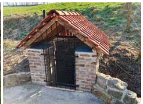
et puits restauré.