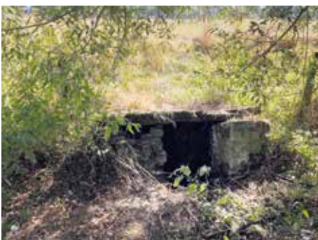
Fig. : puits délabré,

Dans ce cas, ne manquez pas de visiter le site de Mabrouck. .