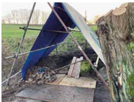
puits en cours de restauration