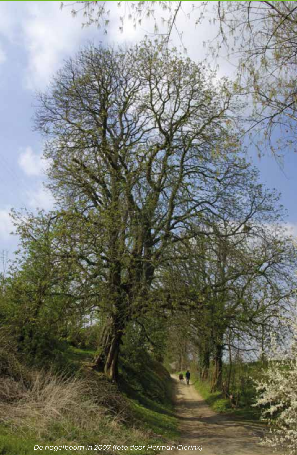
De nagelboom in 2007

Op de zuidelijke helling van de holle weg 'Heuvelke' (vermoedelijk deel van de Romeinse weg 'Via Mansuerisca') in 's-Gravenvoeren stond eeuwenlang een bijzondere boom, in de volksmond ook wel bekend als de nagelboom. De boom was zo bijzonder dat hij in 2015 genomineerd werd voor de wedstrijd van Europese boom van het jaar!