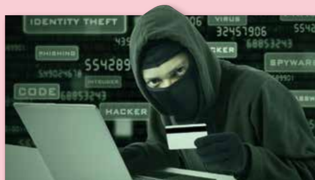
Cette photo d'auteur anonyme est couverte par la licence CC BY-SA